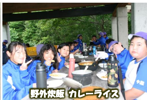
野外炊飯 カレーライス