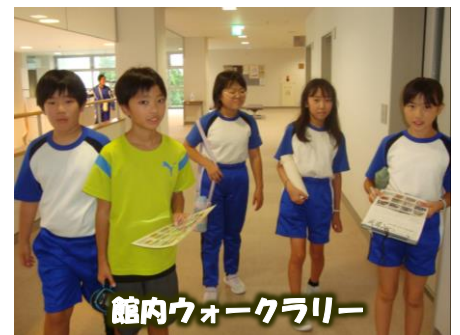
館内ウォークラリー